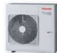
MULTI-SPLIT NEXT RAS-3M26 G3AVG-E (3+1) RAS-4M27 G3AVG-E (4+1) RAS-5M34 G3AVG-E (5+1)