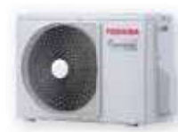
MULTI-SPLIT NEXT RAS-2M14 G3AVG-E (2+1) RAS-2M18 G3AVG-E (2+1) RAS-3M18 G3AVG-E (3+1)